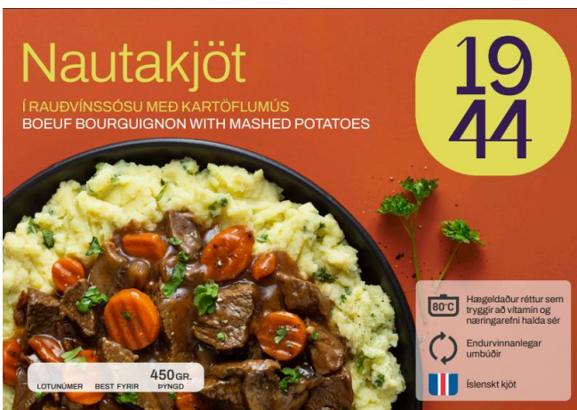
Nautapynnur í rauðvínssösu eru úrvalsmatur

Nýjasta varan, sem fer á smásöluverkað í nóvember, er viðbót við 1944 línu tilbúinna rétta. Ljúffengar nautapynnur í rauðvínssösu, að frönskum hætti, sem þurfa aðeins 12 mínútna hitun í bakarofni.