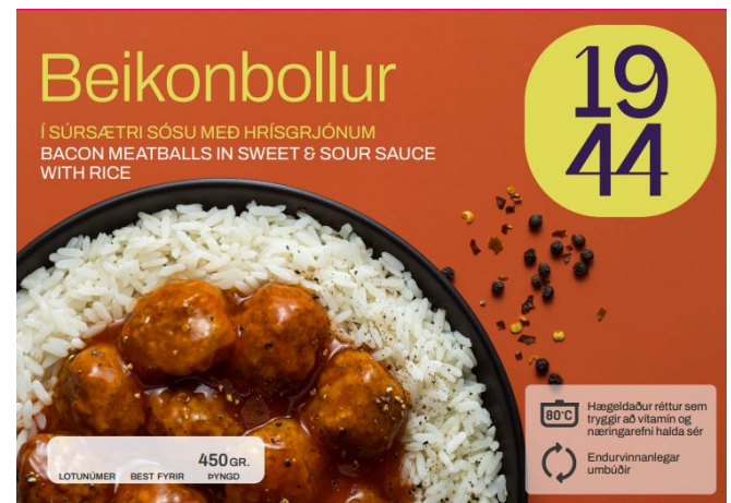
Beikonbollur í 1944 vörulínunni eru ódýr og góður réttur

Það hentar mörgum að grípa tilbúinn mat sem er bragðgóður og á sanngjörnu verði. Síðasta viðbótin við 1944 vörulínuna er á þessum nótum og mælist vel fyrir.