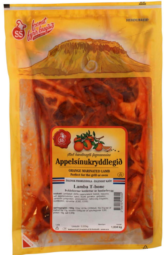
Lundarkótilettur (t-bein) í hentugri þakningu

Í sumar setti SS á markað tvær vörur með appelsínukryddlegi sem mæltust ákaflega vel fyrir. Annars vegar lundarkótilettur sem sjást fyrir neðan og hins vegar hryggvöðva.