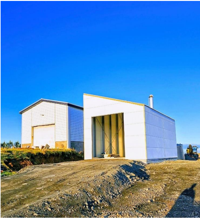
Nýtt ketilhús fyrir 6 megawatta ketil

Á söluhlíðinni var nær engin breyting í heildina enda ekki meira til að selja. Stækkun á markaði fer í innflutt kjöt þar sem skortur hefur verið á nautgripa- og svínakjöti og birgðastaða kindakjöts verið knöpp.