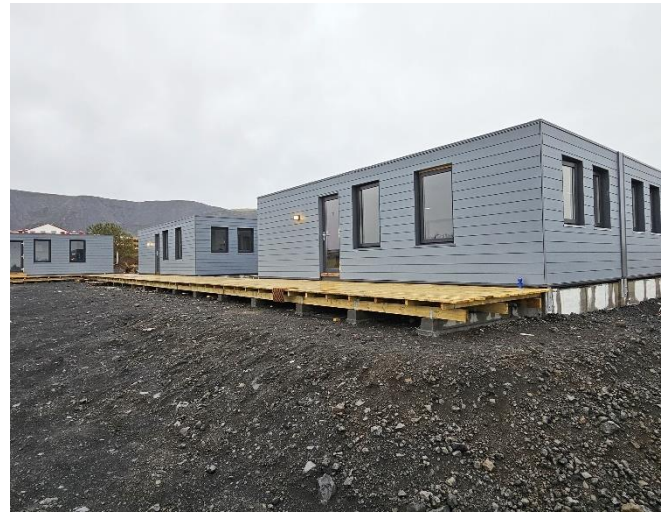
Vönduð starfsmannahús sem rúma 33 starfsmenn

Þrjú starfsmannahús, sem hýsa samtals um 33 starfsmenn, hafa verið tekin í notkun og auðvelda mjög undirbúning sláturtíðar.