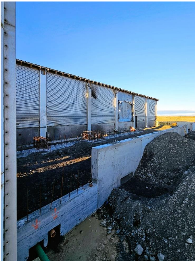
Stækkun á aðalbyggingu fyrir nýjan sjóðara, lyktareyðingu, vatnskældan eimsvala og meira geymslurými