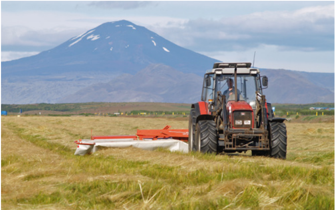
Heyskapur á Rangárvöllum.