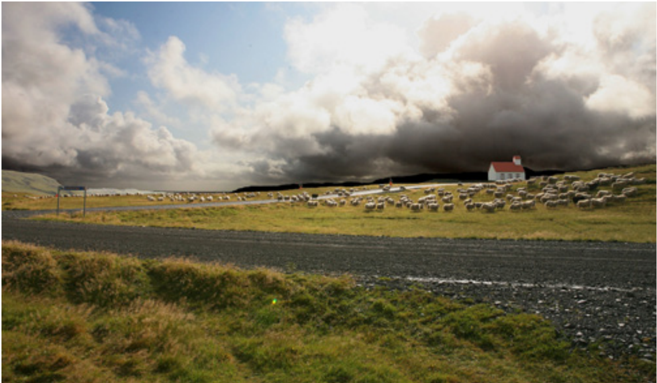
Lömb rekin úr Grafarrétt og heim að Borgarfelli í Skaftártungu.