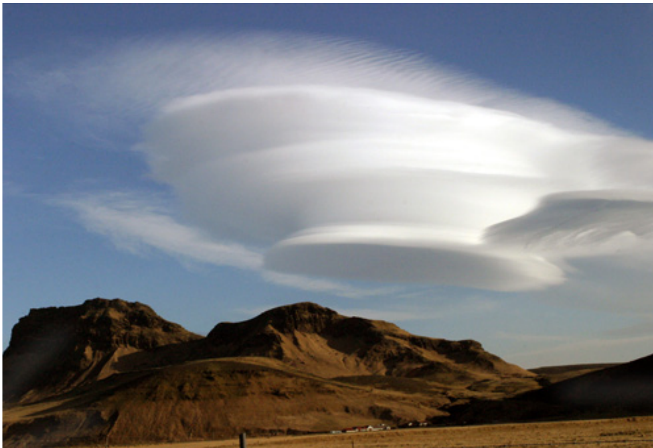
Veðurguð að leik í Mýrdal.